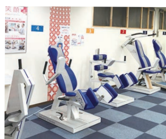
機能訓練スペース