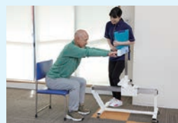
ファンクショナルリーチ

定期的にお身体の状態を確認。筋力、歩行状態を数値化することで、トレーニング効果が目に見える形で確認でき、やる気の向上、効果の実感につながります。