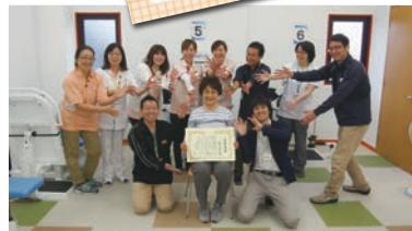
レッツ倶楽部多摩川での卒業式風景